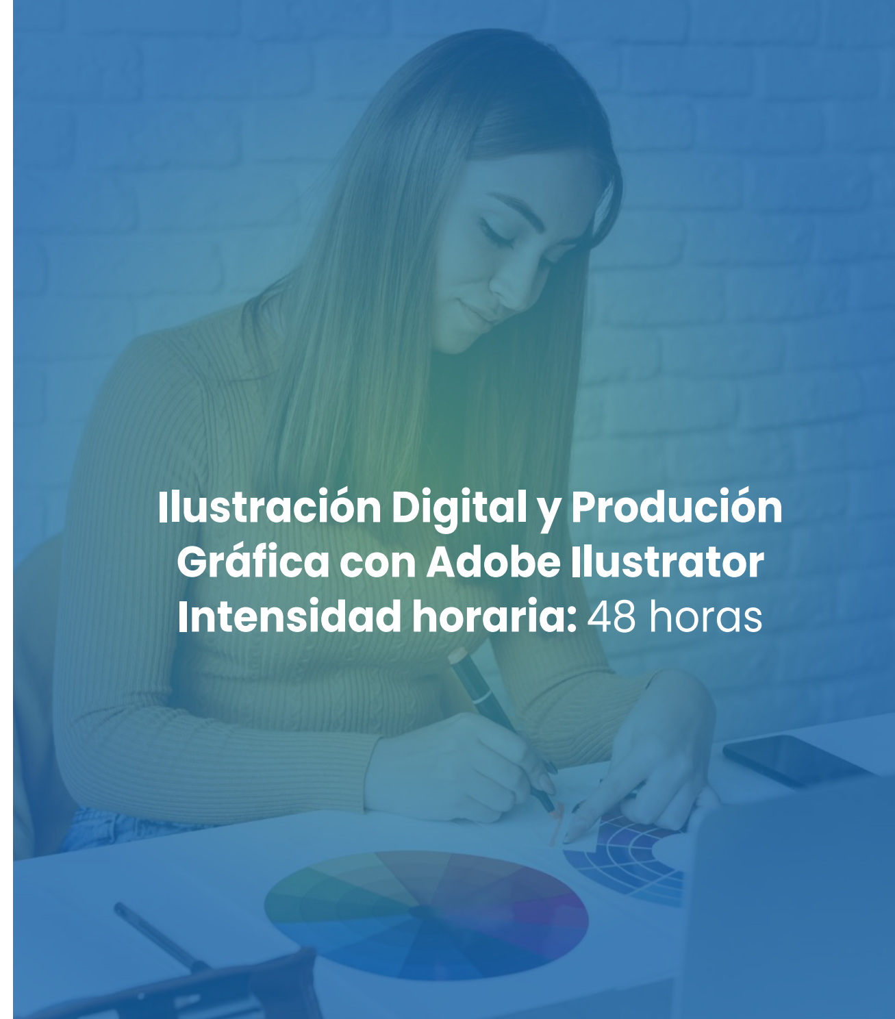
Ilustración Digital y Producción Gráfica con Adobe Illustrator Intensidad horaria: 48 horas